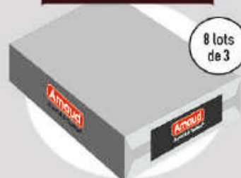
Carton de lots 24 VERRINES