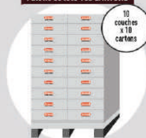
Palette de lots 100 CARTONS