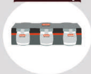
Lot de 3 VERRINES 180g