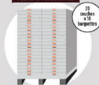
Palette 200 BARQUETTES