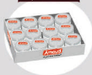
Barquette 12 VERRINES